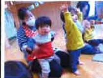
0歳児 サカサカがやってきました!